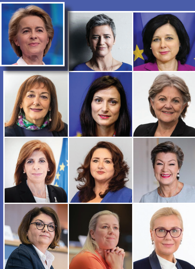
Ursula von der Leyen , presidenta de la Comisión Europea | Margrethe Vestager (vicepresidenta ejecutiva) Una Europa Adaptada a la Era Digital | Věra Jourová (vicepresidenta) Valores y Transparencia | Dubravka Šuica (vicepresidenta) Democracia y Demografía | Mariya Gabriel Innovación, Investigación, Cultura, Educación y Juventud | Elisa Ferreira Cohesión y Reformas | Stella Kyriakides Salud y Seguridad Alimentaria | Helena Dalli Igualdad | Ylva Johansson Asuntos de Interior | Adina Vălean Transportes | Jutta Urpilainen Asociaciones Internacionales | Kadri Simson Energía